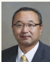
渡辺 竜五 佐渡市長