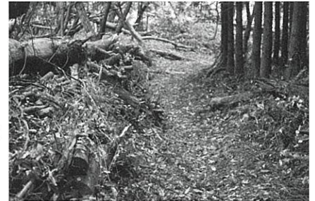
道形が良く残っている鶴子道