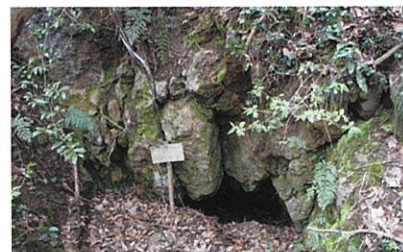
鶴子银山・間歩跡

トレッキングコースにある「鶴子銀山跡」、「上相川地区」は、国の記念物[史跡 佐渡金銀山遺跡]に指定されています。また、コースの古道「西五十里道・鶴子道」が追加指定されることになりました。(官報告示をもって正式決定) この機会にぜひ、山奥にある佐渡金銀山遺跡を探访しましょう！