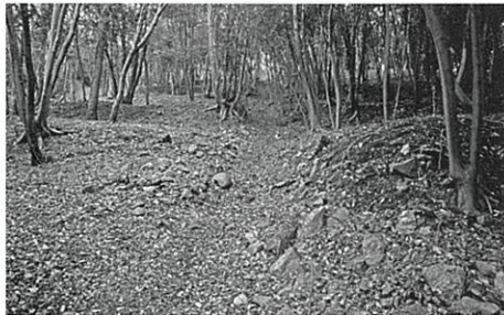
上相川鉱山集落跡のテラス

「上相川地区」は16世紀末から17世紀初頭に相川金銀山の開発にともなって成立した鉱山集落で、鉱山都市相川の礎ともいえる遺跡です。鉱山集落は明治時代に廃絶し、無人となりました