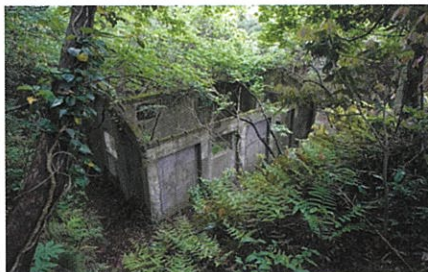
上相川・鉱山火薬庫跡