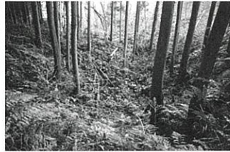
鶴子大露頭掘り跡