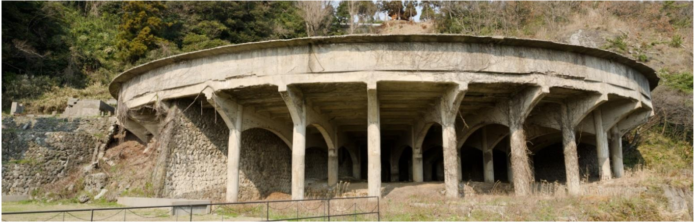
(国史跡 50mシックナー)

日時 平成30年10月6日(土) 10:15~12:00 (集合時間 10:00)