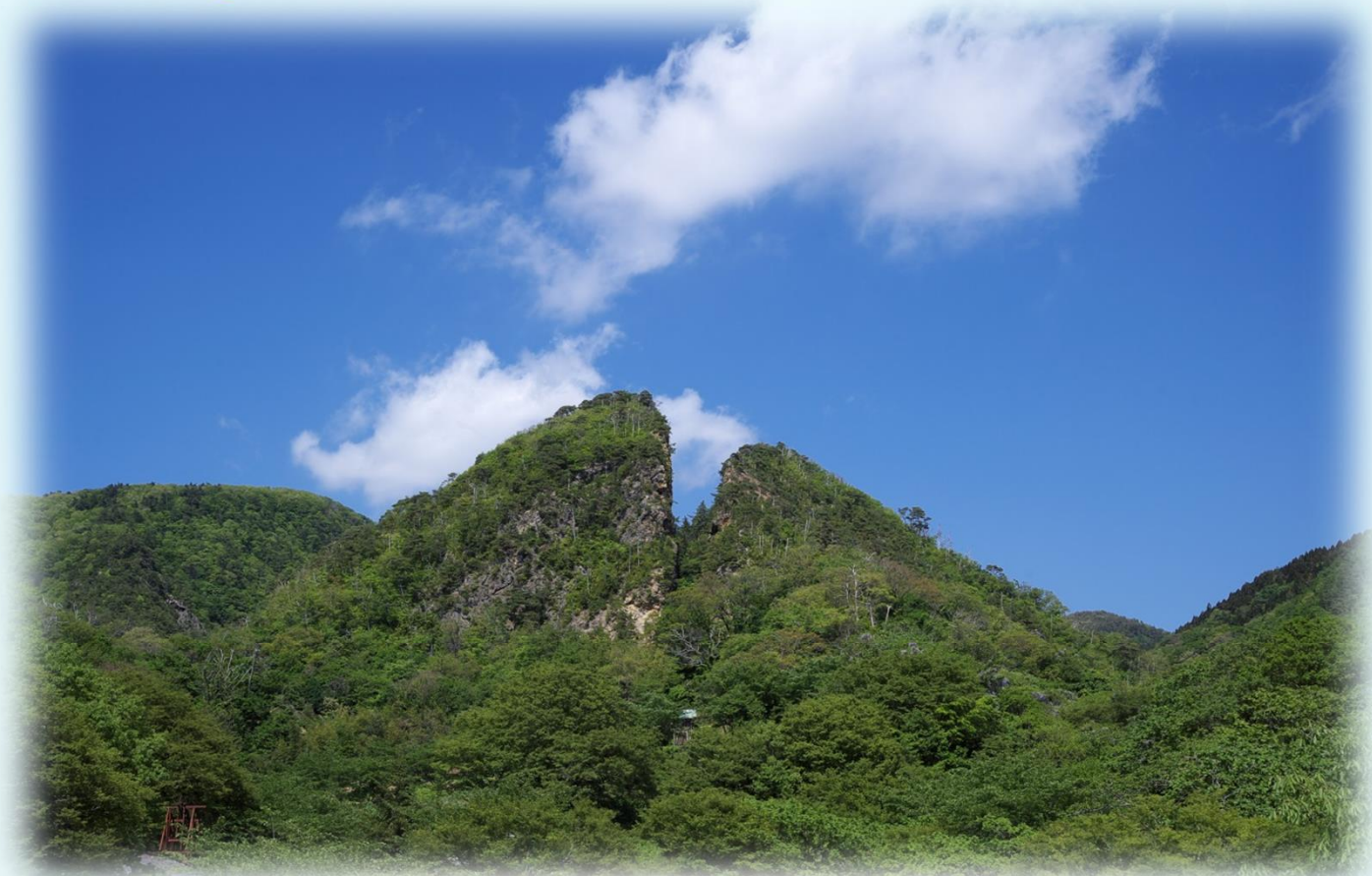
道遊の割戸