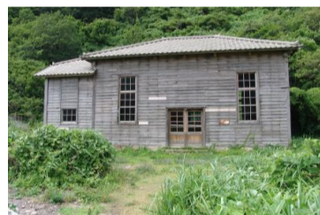
⑨ 户地川第二发电站

江户时代这里曾作为矿山用石磨的下扇石料切割场，在14处采石区内，有105处箭孔痕迹被确认。