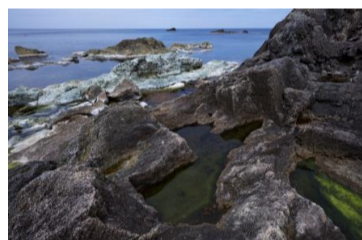
⑦ 吹上海岸切石场遗址

建成于1892年的海港，用于运输矿石和煤炭等生产资料。当时的叠石护岸，桁架桥，以及装载机桥墩和起重机台座等至今仍保存完好。