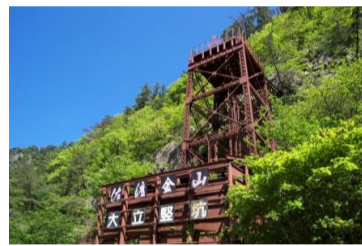
④ 相川金银山(大立竖坑)

从16世纪末开始启动，持续运转400年多年之久的日本最大的金银山。各时代的遗迹和矿山小镇等至今都保留完好，在世界上也实属罕见。道游之割戸是佐渡金银矿山的象征，江户时代寻找矿脉挖掘的痕迹至今可见。