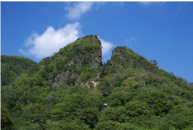
③ 相川金银山（道游之割戸）

银山成为相川金银矿山发现的重要线索。显示从地表向坑道挖掘的痕迹随处可见。大龙间步在江户时代的记录和绘图里也有登场，是鹤子银山代表坑道之一。