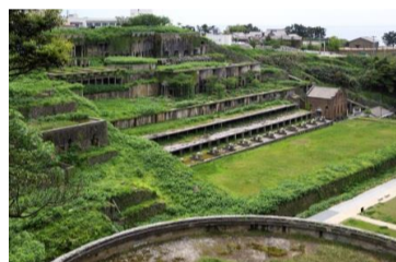
⑤ 相川金银山（北泽浮游选矿场）

于1877年完工的贵金属矿山作为西式竖坑在日本尚属首例。用于搬运矿石，人员，物资等，最深处达352m。是象征国内矿业近代化的建筑之一。