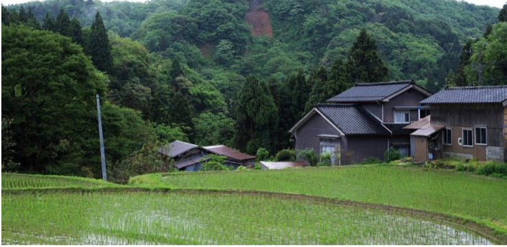
① 西三川砂金山（虎丸山）

据推断砂金山的采掘始于平安时代末期(12世纪末)。虎丸山是西三川砂金山中最大的开采地，因采掘砂金而坍塌的山体斜面，至今也不生长任何植被，只有赤红色的山岩一如往昔。