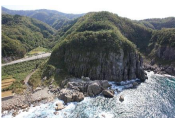
⑧ 片边・鹿野浦海岸切石场遗址

这里曾作为矿山用石磨的上扇石料切割场，从近世到近代一直被长期开采，海岸线边岩石场至今还遗留着大量的箭孔痕迹和钢凿痕迹等。