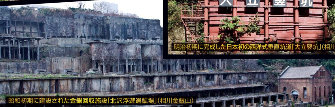
昭和初期に建設された金銀回収施設「北沢浮遊選鉱場」(相川金銀山)