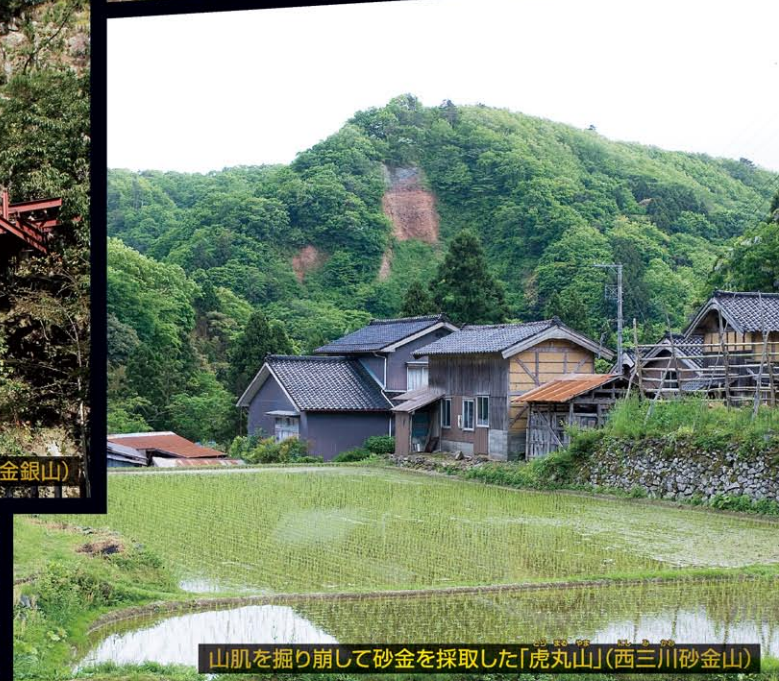
山肌を掘り崩して砂金を採取した「虎丸山」(西三川砂金山)