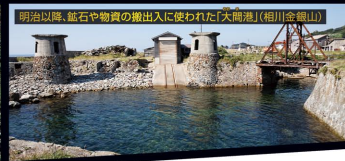
明治以降、鉱石や物資の搬出入に使われた「大間港」(相川金銀山)