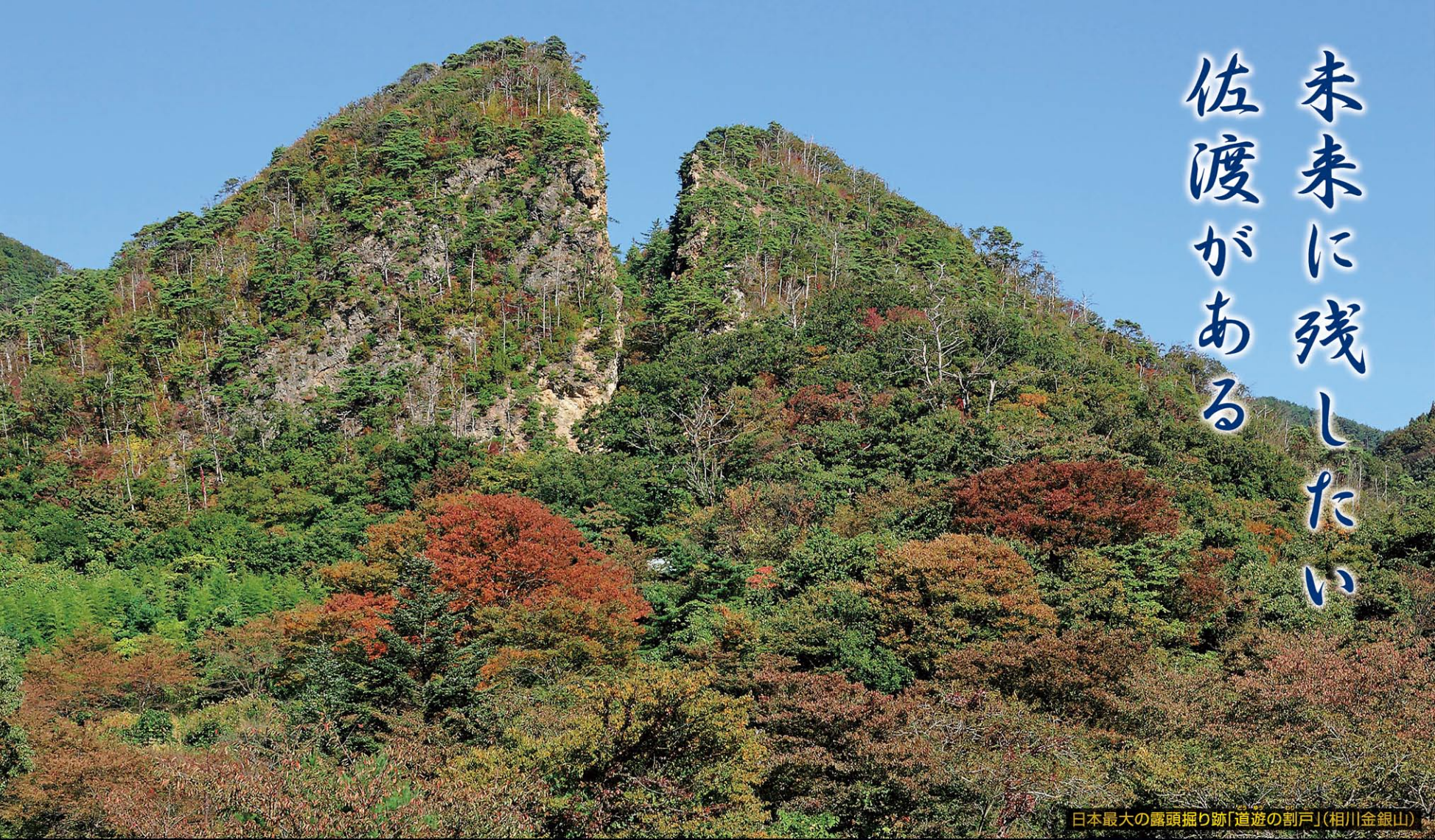
日本最大の露頭掘り跡「道遊の割戸」(相川金銀山)