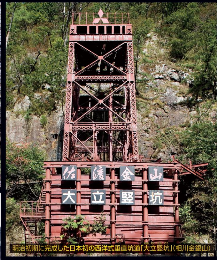
明治初期に完成した日本初の西洋式垂直坑道「大立堅坑」(相川金銀山)